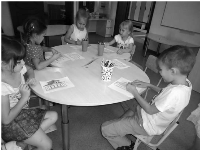
Капитаны за работой

Малышей заинтересовало и удивило то, что внешнее и внутреннее оформление каждого театра индивидуально. Позже они представляли это в своих рисунках.