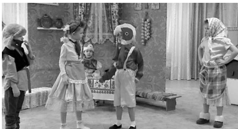
Спектакль «Вот так история», 2017 г.

В основе деятельности идея взаимодействия взрослого и ребенка. Процесс театрализации рассчитан на активное участие ребенка, где он становится равноправным участником педагогического процесса.