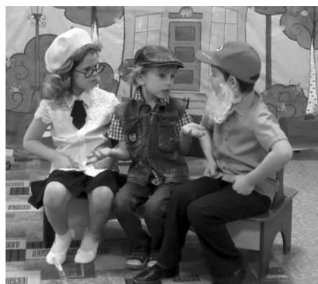
Спектакль «Превращения всем на удивление», 2019 г.