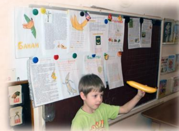
«Банан» Выполнил: Илья К.