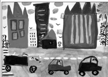
«Моя улица» Лада Гаврилюк, 5 лет