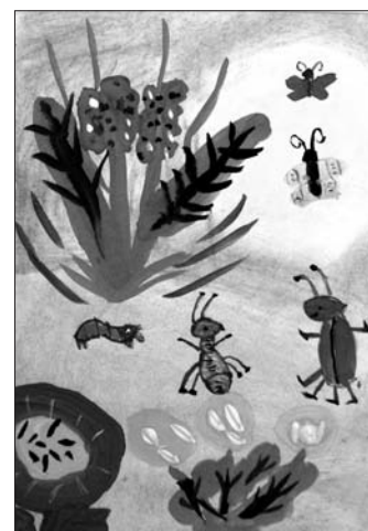
«Веселая лужайка» Даша Прусс, 6 лет