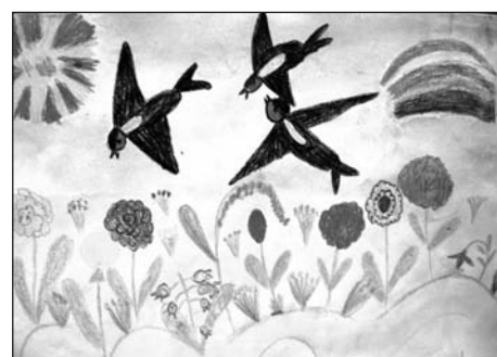
«Песня лета» Арина Ткаченко, 5 лет