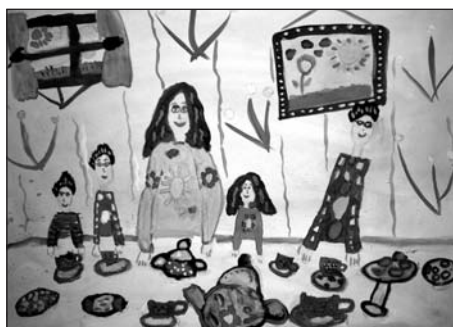
«Семейное чаепитие» Рита Белкина, 6 лет