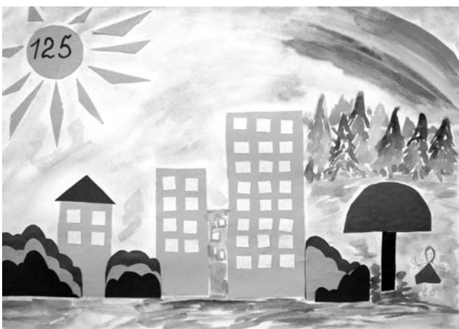
«Любимому городу – 125!» Эльвира Гучманидзе, 5 лет Совместная работа с мамой