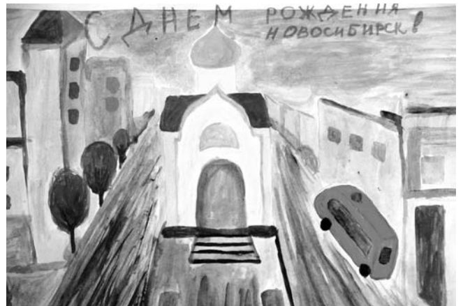
«Город готовится к празднику». Никита Бочкарев, 5 лет Совместная работа с мамой