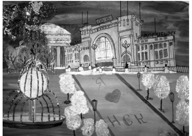
«Праздничный салют». Демьян Плужников, 3 года Совместная работа с мамой