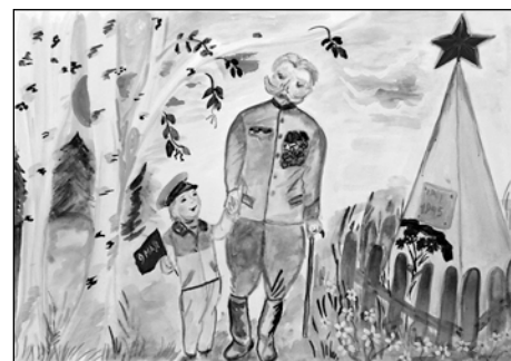
Софья Фомичева, МКДОУ № 508. С дедом на парад