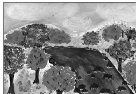
Ксения Ключкина. Осень