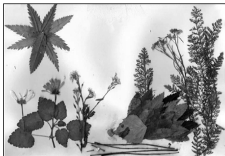
Вероника Кузнецова. Ёжик