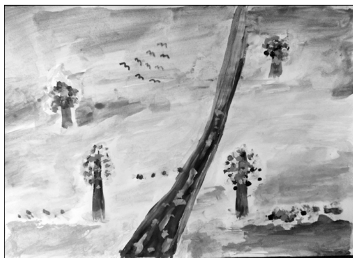
Кирилл Охрименко. Осень