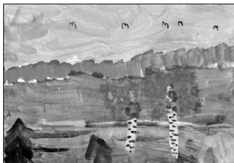
Лиза Байкалова. Улетают птицы