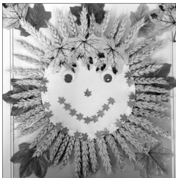
Коллективная работа детей группы № 2. Осеннее солнышко