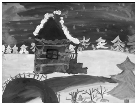
Лиза Панченко, МКДОУ д/с № 42. Домик у реки зимой