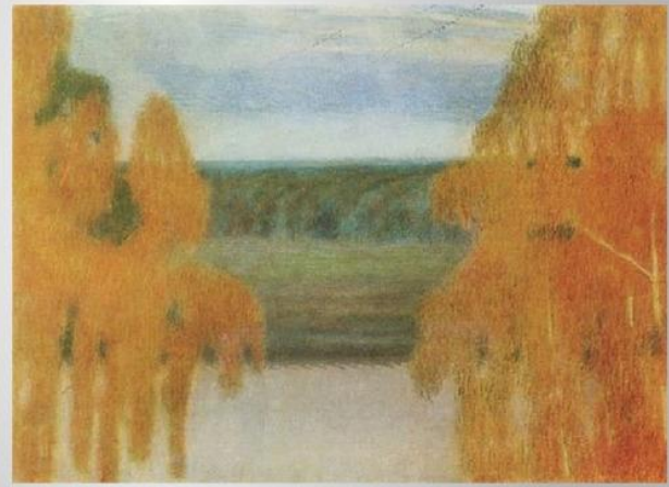
В.Борисов-Мусатов «Осенняя песня»