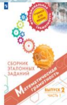
Математическая грамотность. Сборник эталонных заданий. Выпуск 2. Часть 1