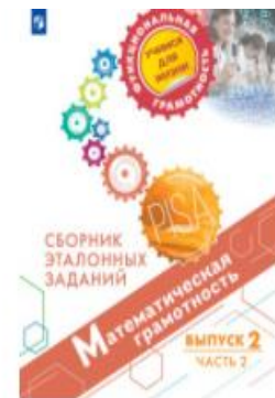
Математическая грамотность. Сборник эталонных заданий. Выпуск 2. Часть 2