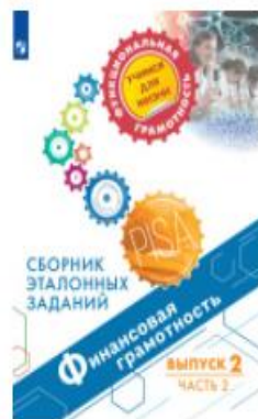
Финансовая грамотность. Сборник эталонных заданий. Выпуск 2. Часть 2