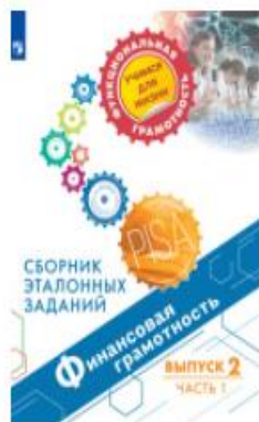
Финансовая грамотность. Сборник эталонных заданий. Выпуск 2. Часть 1