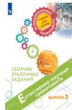
Естественно-научная грамотность. Сборник эталонных заданий. Выпуск 2