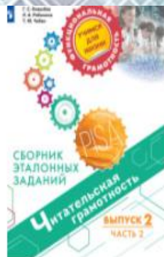
Читательская грамотность. Сборник эталонных заданий. Выпуск 2. Часть 2