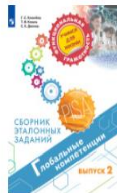
Глобальные компетенции. Сборник эталонных заданий. Выпуск 2