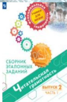
Читательская грамотность. Сборник эталонных заданий. Выпуск 2. Часть 1