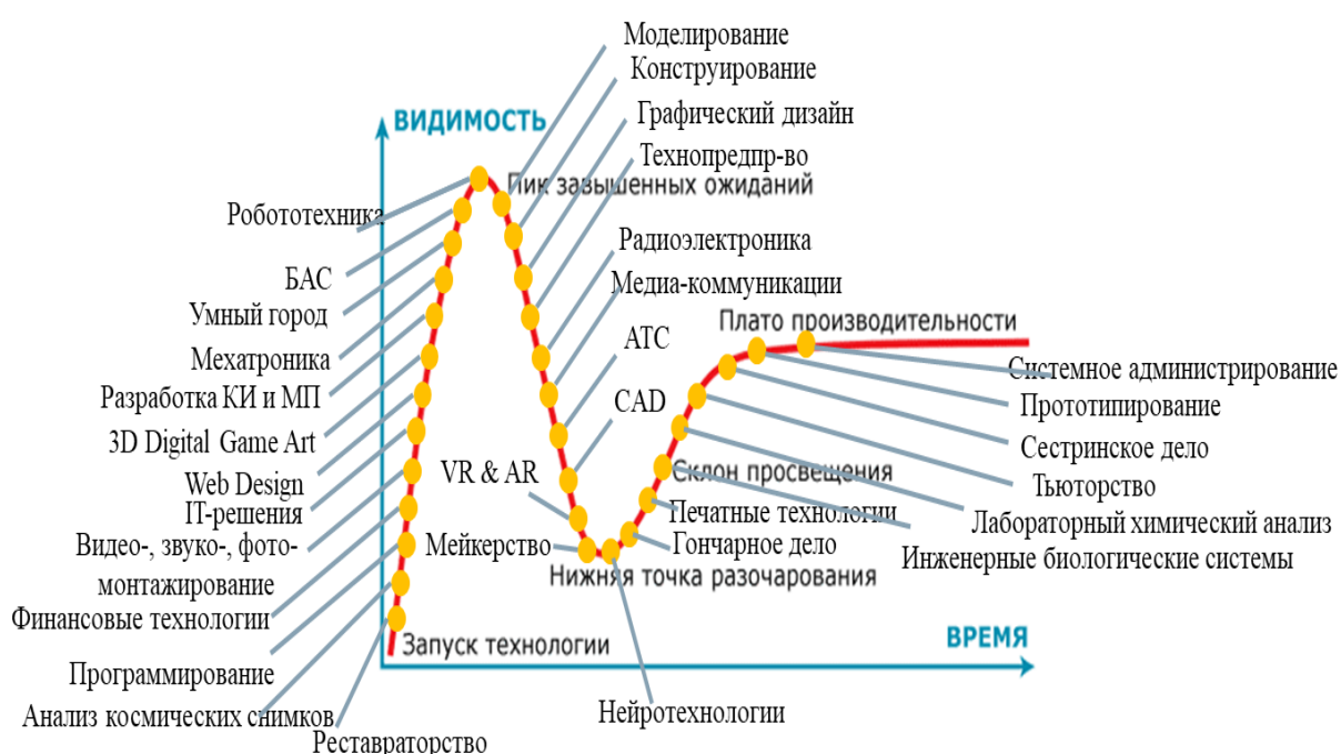
График Гартнера визуализирует ожидания разработчиков проекта по формированию актуальных компетенций матрицы НТИ. Он демонстрирует те компетенции, которые потенциально могут обеспечить образовательной организации конкурентные преимущества. Синергетический эффект этих компетенций способствует овладению выпускником профессиями будущего.

обеспечит открытость технологического образования для всех категорий обучающихся с ОВЗ, создавая новые модели и тренды инклюзивного образования и транслируя этот опыт. «Технолифт» и «VUCA-balance» сформируют у обучающихся необходимые адаптивные психологические механизмы самореализации и самоактуализации, а также ключевые навыки 21 века. Продуктами реализации проектной линии «Инклюзивный трамплин» могут стать прочно сформированные социально-бытовые навыки и жизненные компетенции детей с ОВЗ. «Технолифт» и «Иннопрактика» сделают школу холдером сквозных технологий. Произойдет перестройка образовательной среды: возрастет число фаблабов, полигонов, коворкинг центров и мобильных пространств.