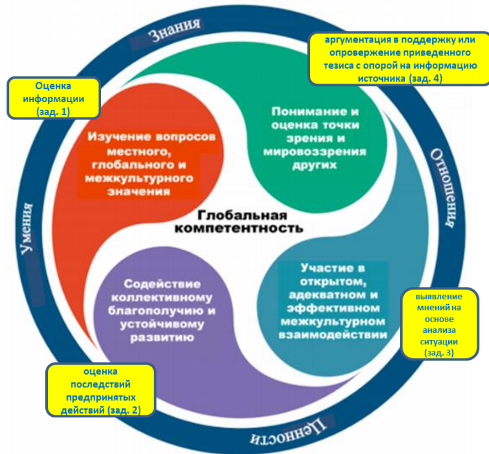
Рис. 1. Концептуальная модель оценки глобальных компетенций